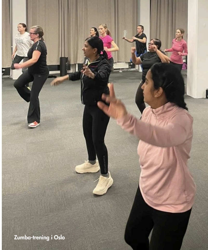
Zumba-trening i Oslo