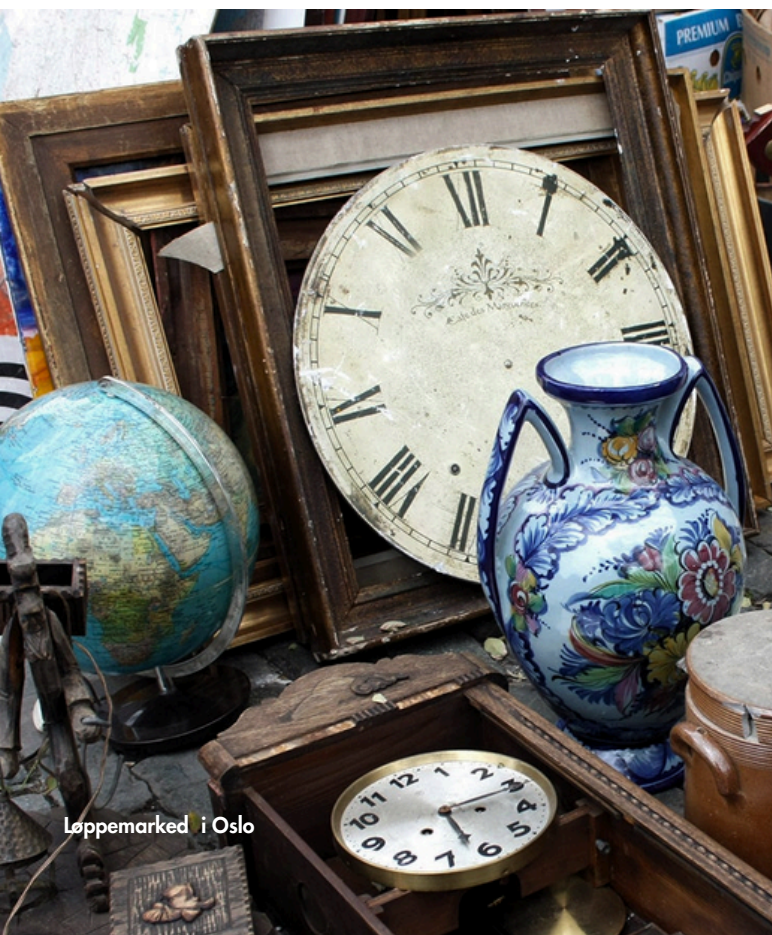
Loppemarked i Oslo

Arrangementet understreker Mangfoldshusets mål om å være et inkluderende samlingspunkt som styrker fellesskapet i nærmiljøet.