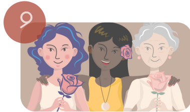
9 Kvinne rettigheter Ungblikk