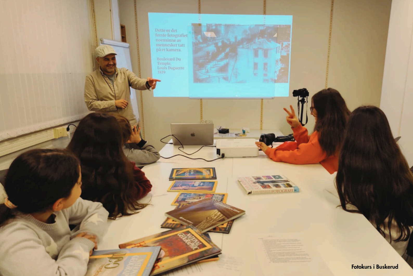
Fotokurs i Buskerud