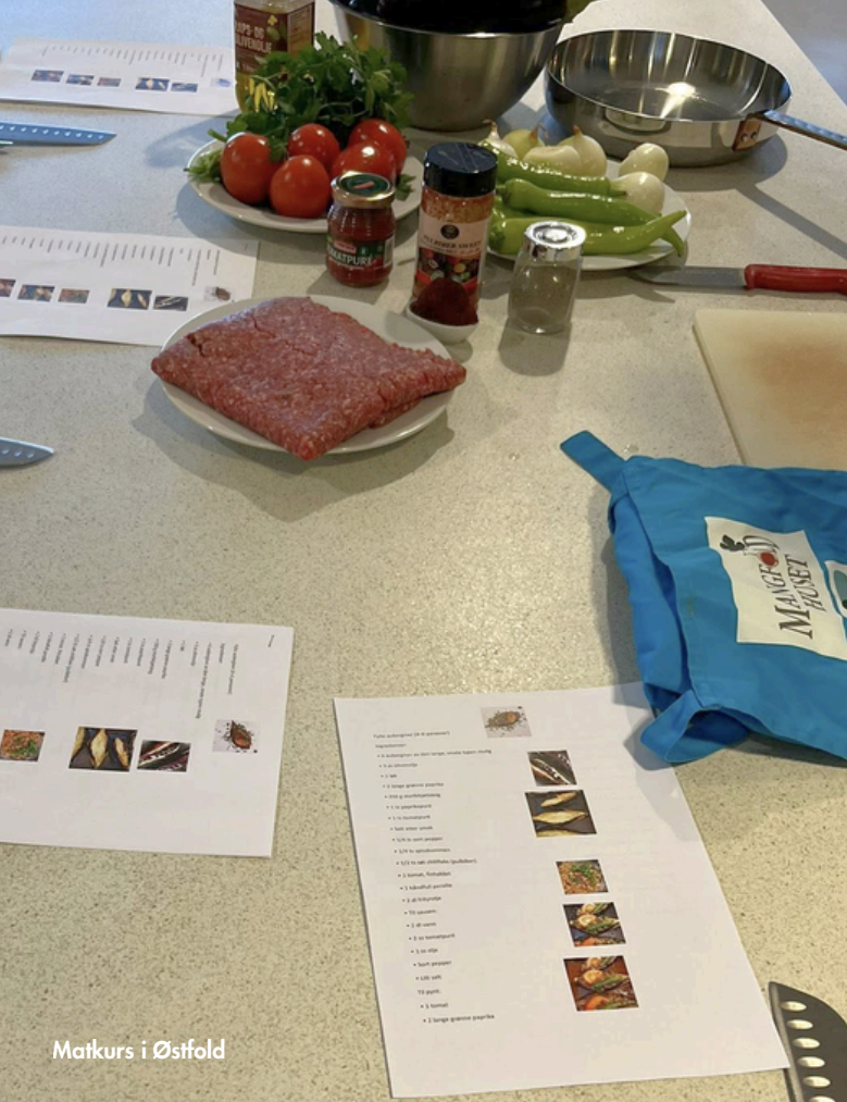
Matkurs i Østfold