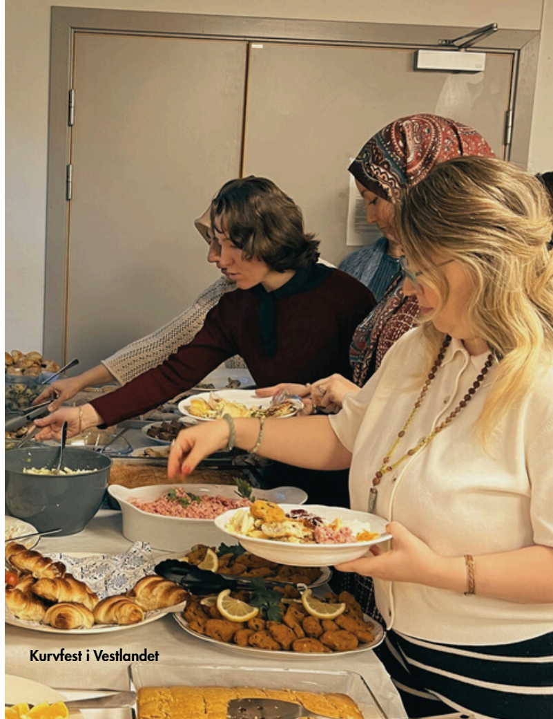
Kurvfest i Vestlandet

Arrangørene takker alle som deltok og bidro til en vellykket og minnerik kurvfest.