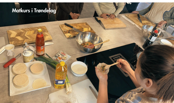
Matkurs i Trøndelag

Aktiviteten bidro til både kulturell læring og sosialt fellesskap i trygge og åpne omgivelser. Vi ser frem til nye matkurs og flere gode møter.