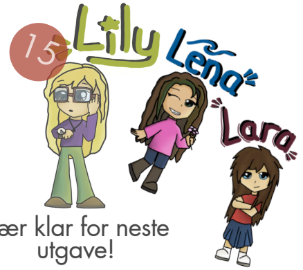
15 Lily Lena Lara Vær klar for neste utgave!