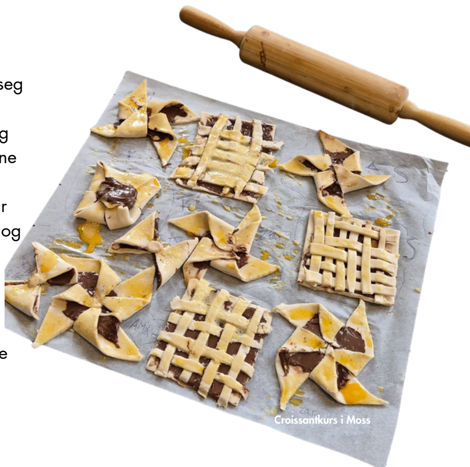
Croissantkurs i Moss

Aktiviteten ga rom for læring, samarbeid og sosialt fellesskap. Mangfoldshuset Østfold takker alle barna som deltok, og ser frem til flere aktiviteter i tiden fremover.